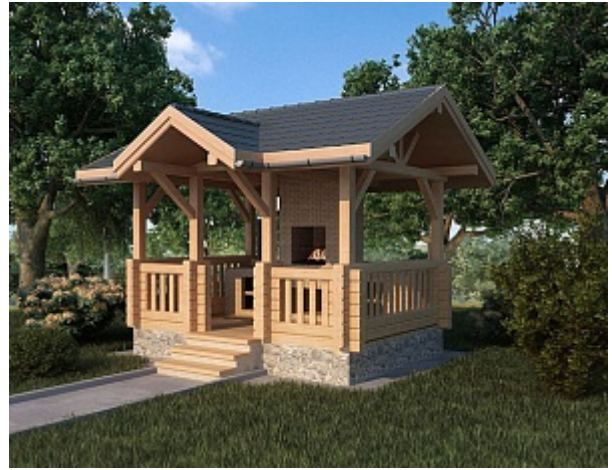
Проект беседки Б 12