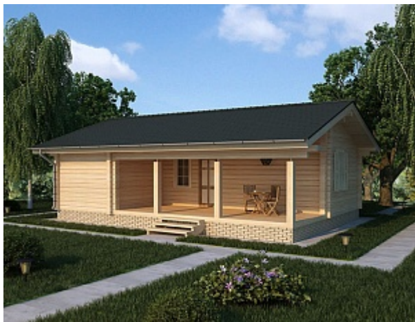
Проект одноэтажного дома 8 на 10 ДКБ 55