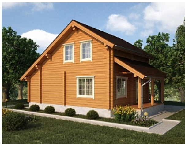
Готовый проект дома из профилированного клееного бруса ДКБ 96