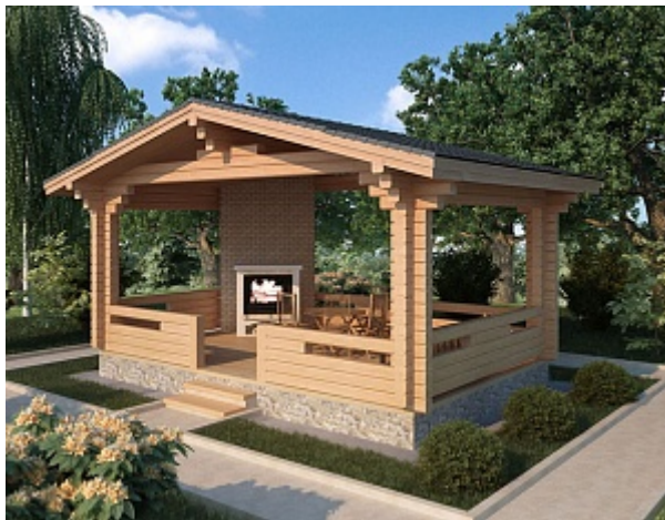
Проект беседки Б 20