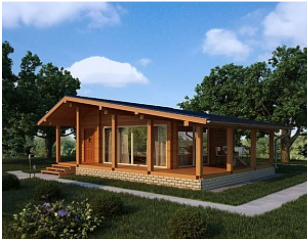
Проект бани из клееного бруса ББ 49