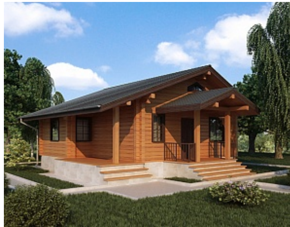
Проект одноэтажного дома 10 на 12 ДКБ-82