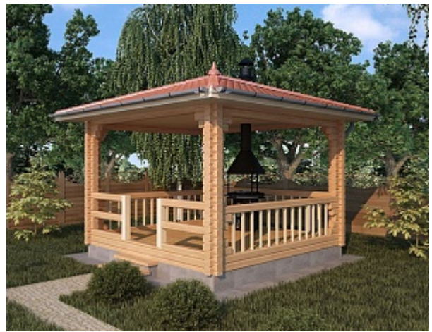
Проект беседки Б 16