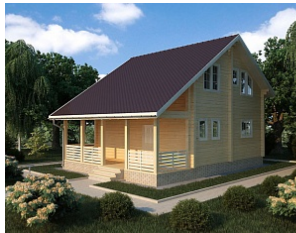
Проект дома из профилированного бруса 8x10 ДКБ 104

120,5 м 2 7,8x10,3 м Цена: 1 255 000 руб